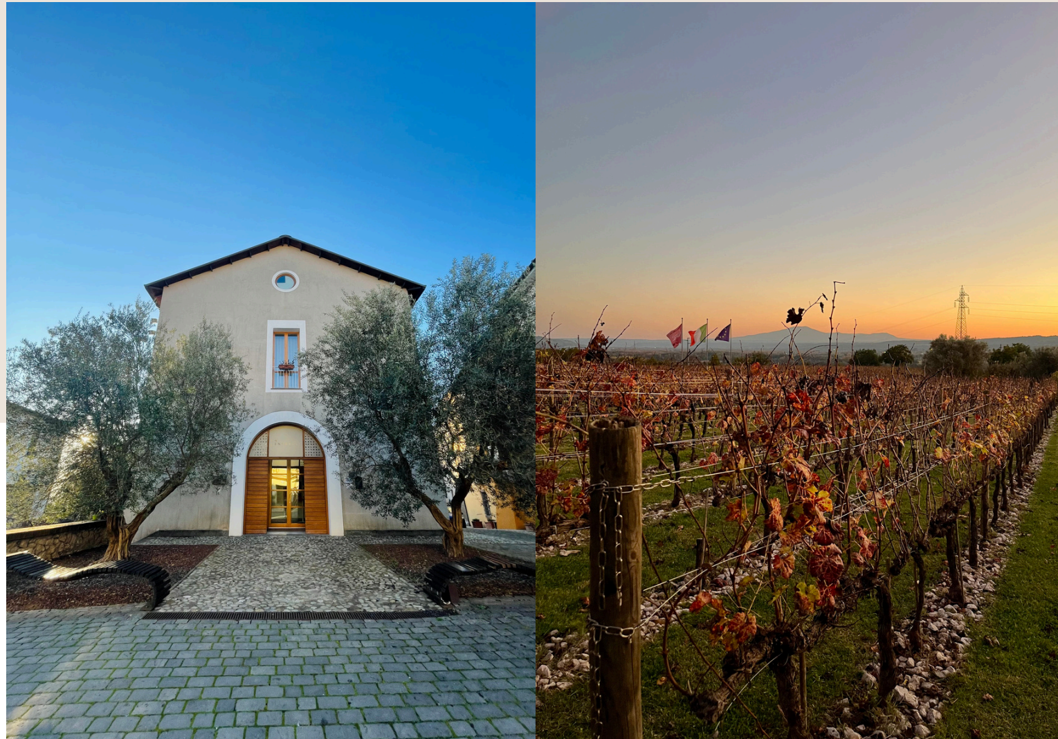
"Una giornata in Accademia"

Visita del Campus, pranzo nel ristorante didattico e tour dell'azienda Famiglia Cotarella, dedicata agli studenti e ai docenti